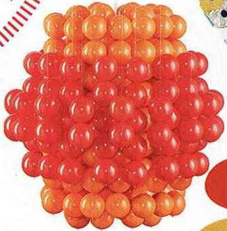
⬆️ Люстра Ball, дизайн Вернера Пантона