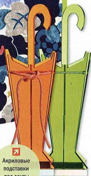
⬆️ Акриловые подставки под зонты от G-Spot